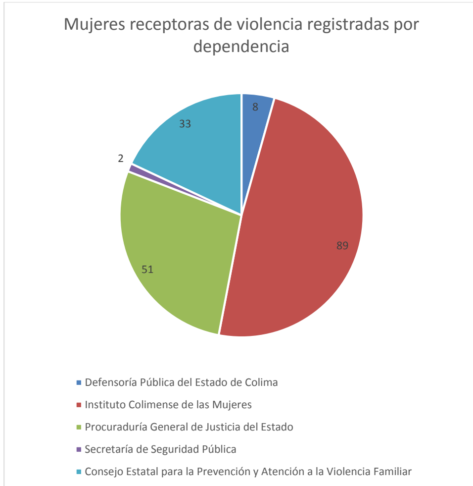
3 Gráfica de la cantidad de casos de violencia capturados por dependencia.

Mientras que en la gráfica 3, se identifican a las dependencias del Estado de Colima que registraron la información de 183 personas en el banco de datos.