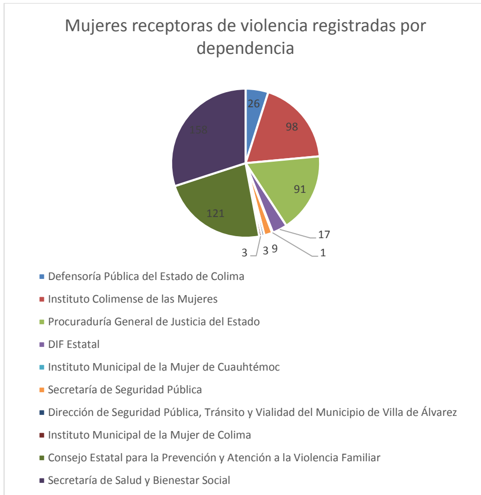
3 Gráfica de la cantidad de casos de violencia capturados por dependencia.

Mientras que en la gráfica 3, se identifican a las dependencias del Estado de Colima que registraron la información de 527 personas en el banco de datos.