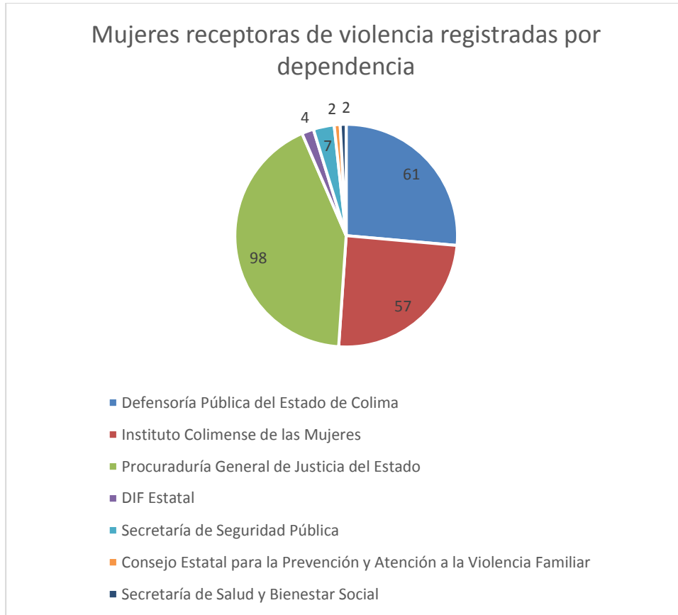
3 Gráfica de la cantidad de casos de violencia capturados por dependencia.

Mientras que en la gráfica 3, se identifican a las dependencias del Estado de Colima que registraron la información de 231 personas en el banco de datos.