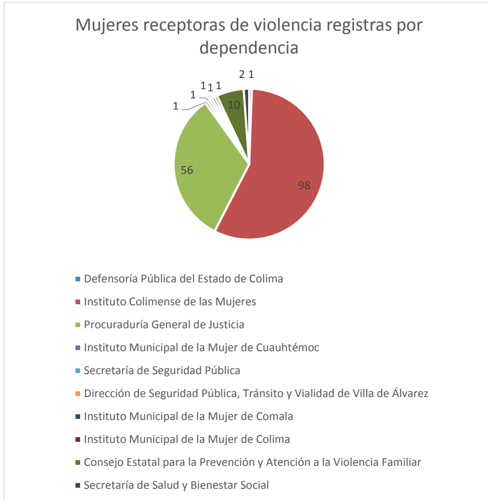
3 Gráfica de la cantidad de casos de violencia capturados por dependencia.

Mientras que en la gráfica 3, se identifican a las dependencias del Estado de Colima que registraron la información de 172 personas en el banco de datos.