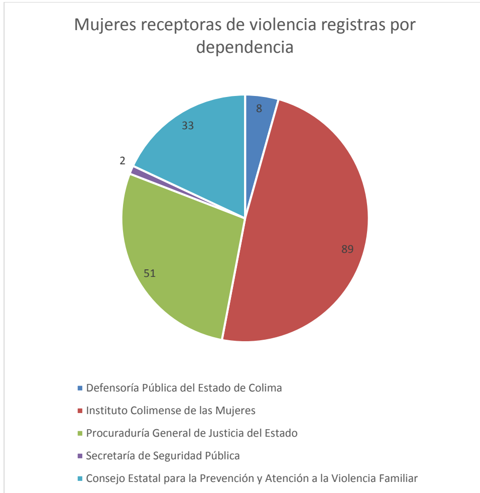
3 Gráfica de la cantidad de casos de violencia capturados por dependencia.

Mientras que en la gráfica 3, se identifican a las dependencias del Estado de Colima que registraron la información de 183 personas en el banco de datos.