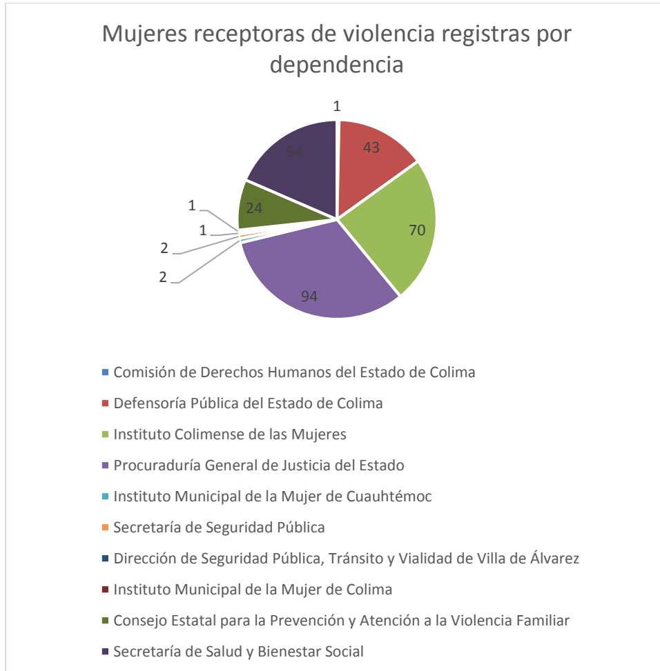
3 Gráfica de la cantidad de casos de violencia capturados por dependencia.

Mientras que en la gráfica 3, se identifican a las dependencias del Estado de Colima que registraron la información de 292 personas en el banco de datos.