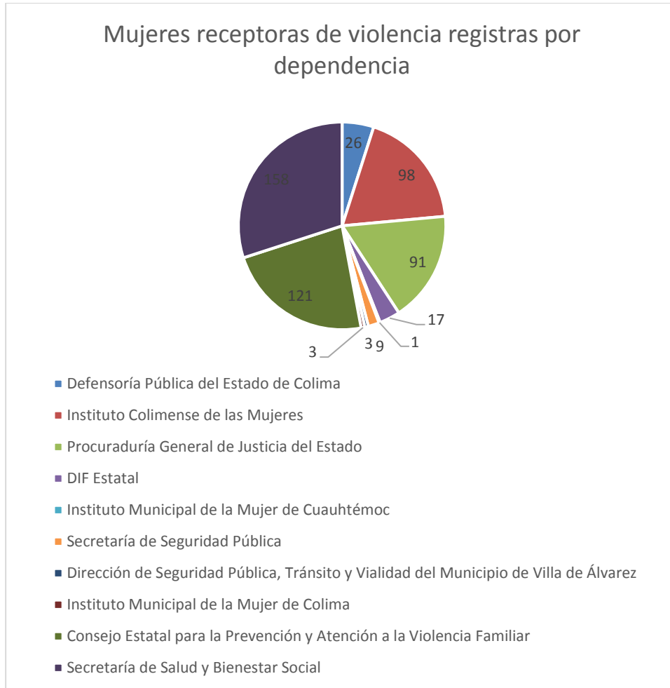
3 Gráfica de la cantidad de casos de violencia capturados por dependencia.

Mientras que en la gráfica 3, se identifican a las dependencias del Estado de Colima que registraron la información de 527 personas en el banco de datos.