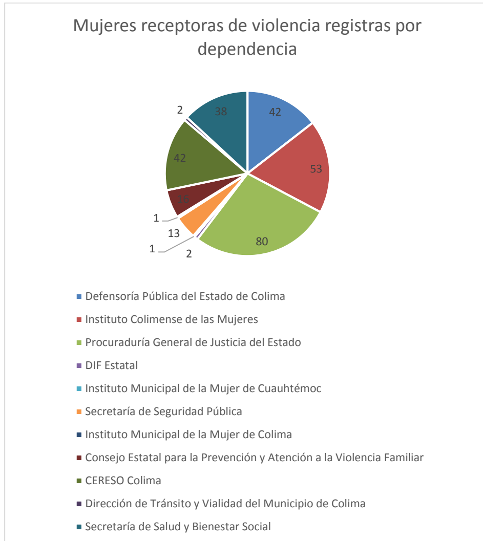
3 Gráfica de la cantidad de casos de violencia capturados por dependencia.

2 Gráfica de casos registrados por modalidad de violencia contra las mujeres. Mientras que en la gráfica 3, se identifican a las dependencias del Estado de Colima que registraron la información de 290 personas en el banco de datos.