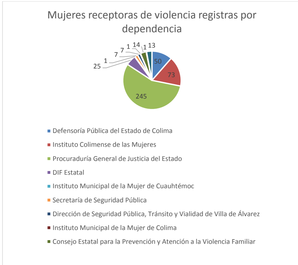
3 Gráfica de la cantidad de casos de violencia capturados por dependencia.

Mientras que en la gráfica 3, se identifican a las dependencias del Estado de Colima que registraron la información de 527 personas en el banco de datos.