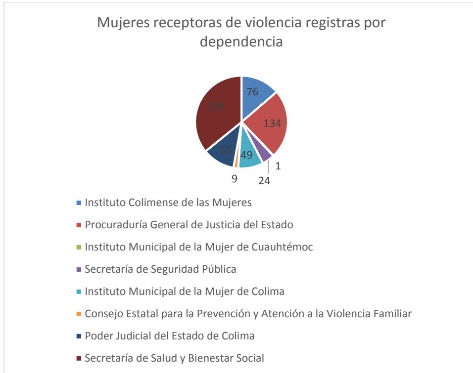
3 Gráfica de la cantidad de casos de violencia capturados por dependencia.

Mientras que en la gráfica 3, se identifican a las dependencias del Estado de Colima que registraron la información de 555 personas en el banco de datos.