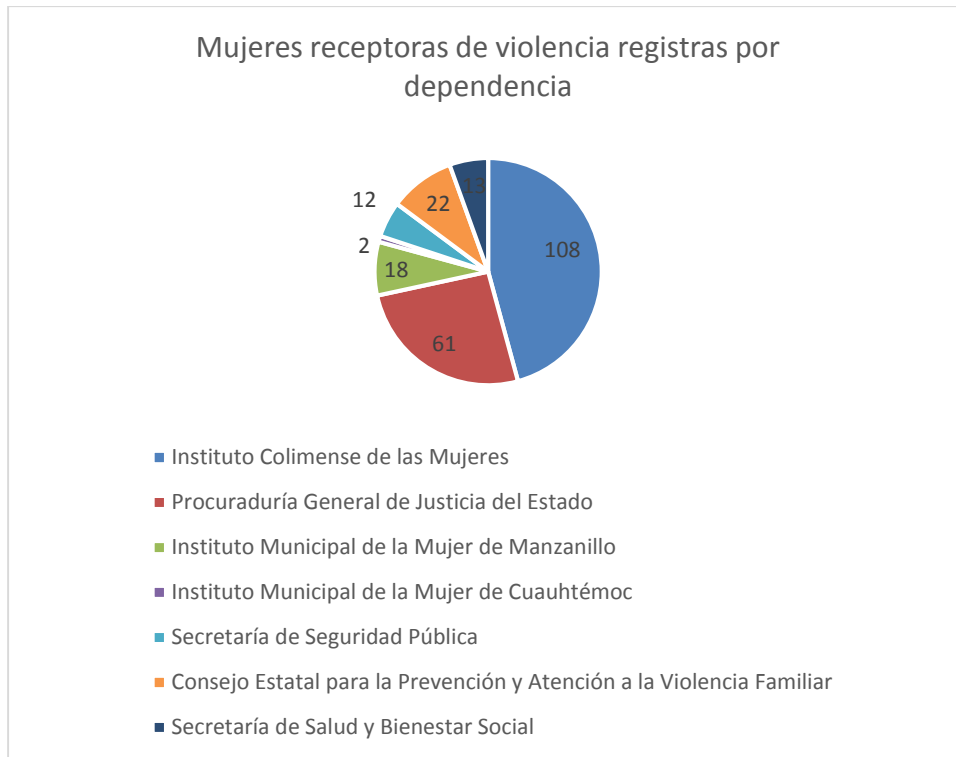
3 Gráfica de la cantidad de casos de violencia capturados por dependencia.

Mientras que en la gráfica 3, se identifican a las dependencias del Estado de Colima que registraron la información de 236 personas en el banco de datos.