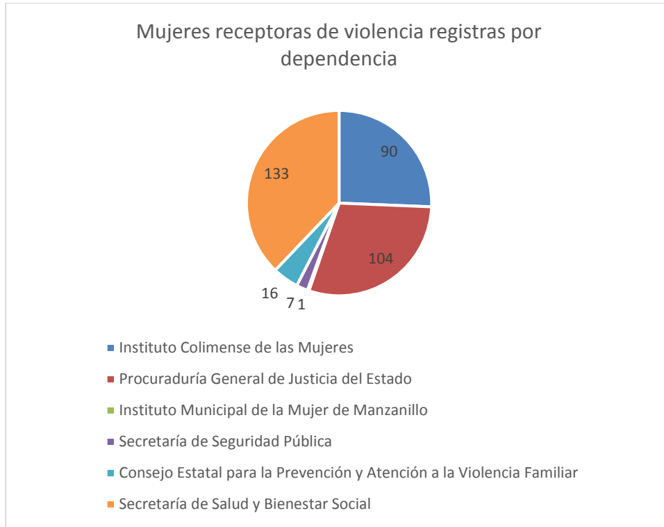
3 Gráfica de la cantidad de casos de violencia capturados por dependencia.

Mientras que en la gráfica 3, se identifican a las dependencias del Estado de Colima que registraron la información de 351 personas en el banco de datos.