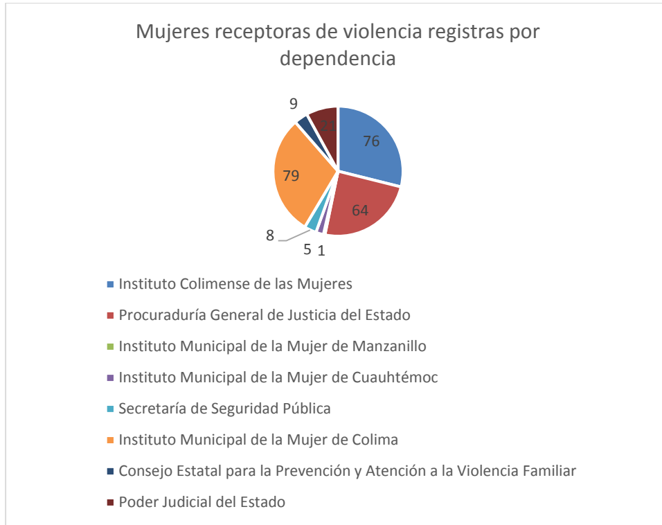
3 Gráfica de la cantidad de casos de violencia capturados por dependencia.

Mientras que en la gráfica 3, se identifican a las dependencias del Estado de Colima que registraron la información de 263 personas en el banco de datos.