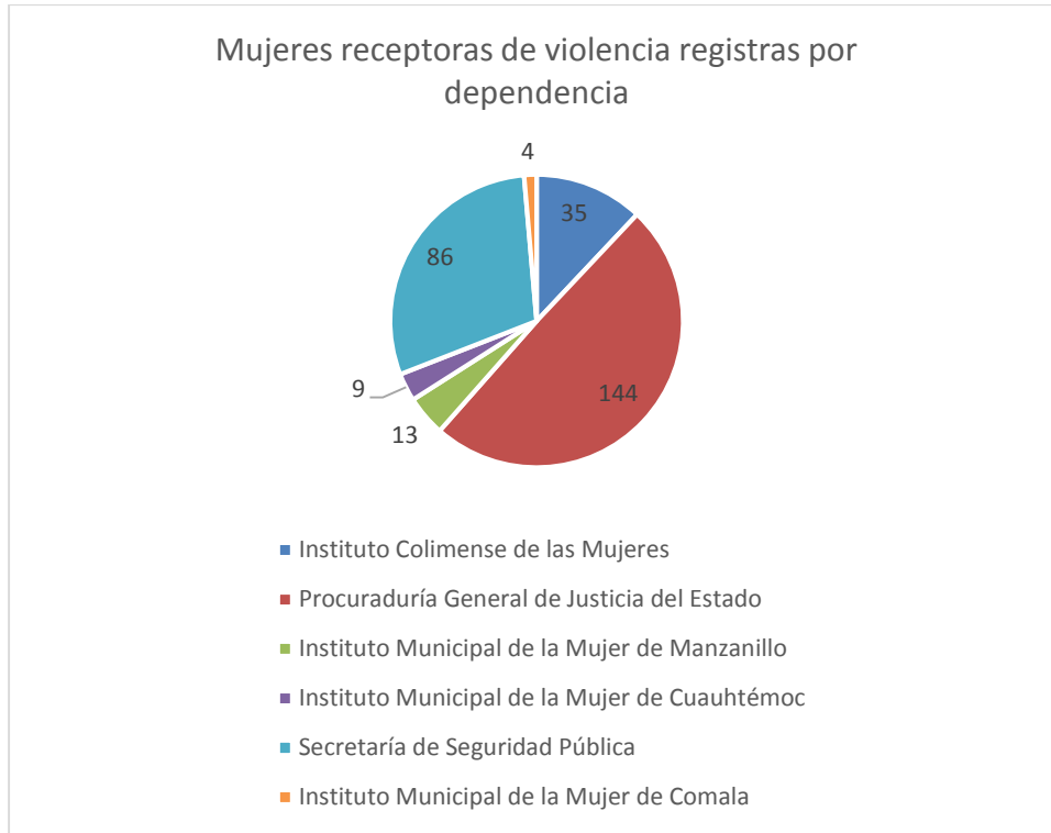
3 Gráfica de la cantidad de casos de violencia capturados por dependencia.

Mientras que en la gráfica 3, se identifican a las dependencias del Estado de Colima que registraron la información de 291 personas en el banco de datos.