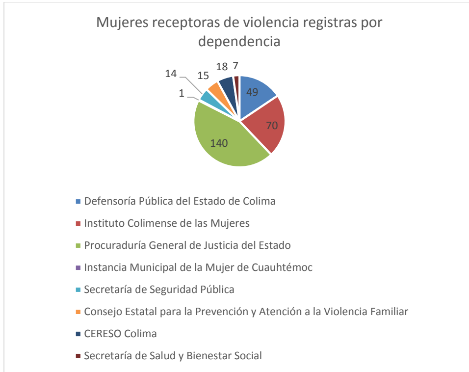
3 Gráfica de la cantidad de casos de violencia capturados por dependencia.

Mientras que en la gráfica 3, se identifican a las dependencias del Estado de Colima que registraron la información de 314 personas en el banco de datos.