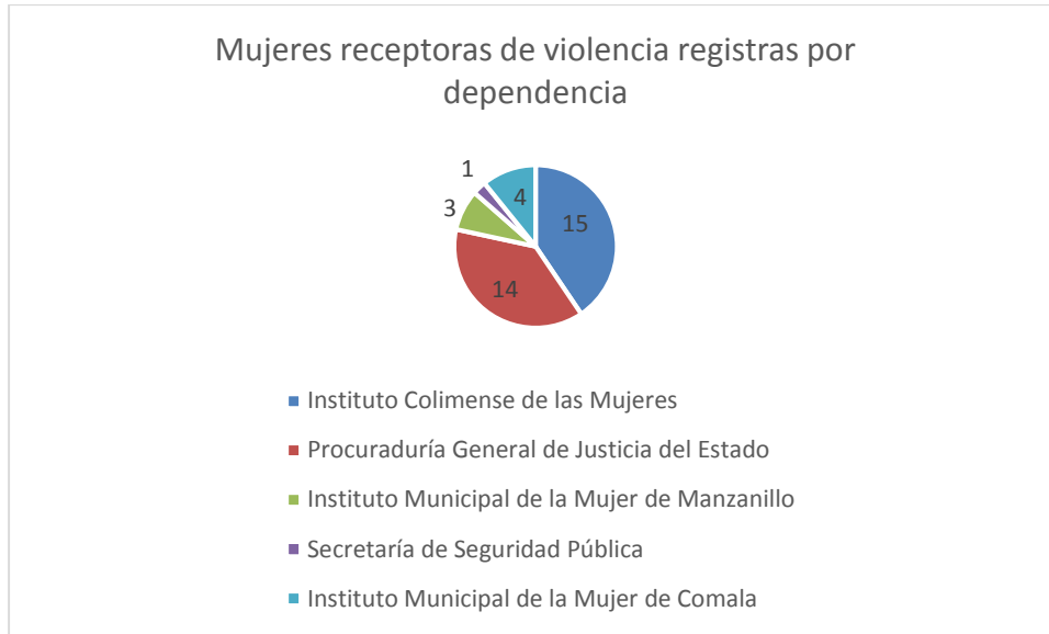
3 Gráfica de la cantidad de casos de violencia capturados por dependencia.

Mientras que en la gráfica 3, se identifican a las dependencias del Estado de Colima que registraron la información de 37 personas en el banco de datos.