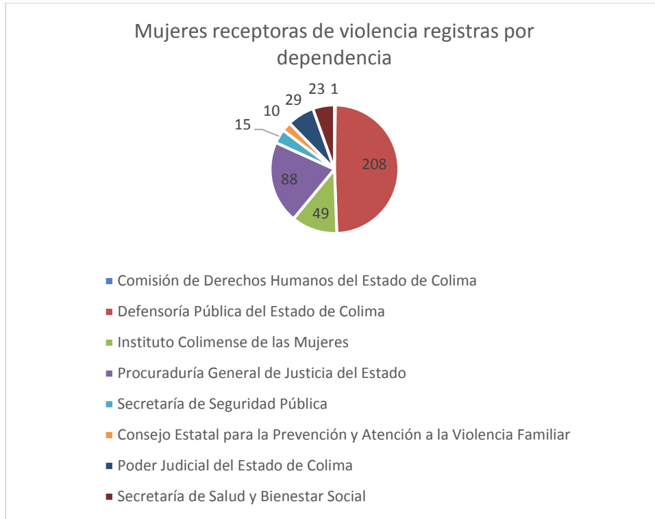
3 Gráfica de la cantidad de casos de violencia capturados por dependencia.

Mientras que en la gráfica 3, se identifican a las dependencias del Estado de Colima que registraron la información de 423 personas en el banco de datos.