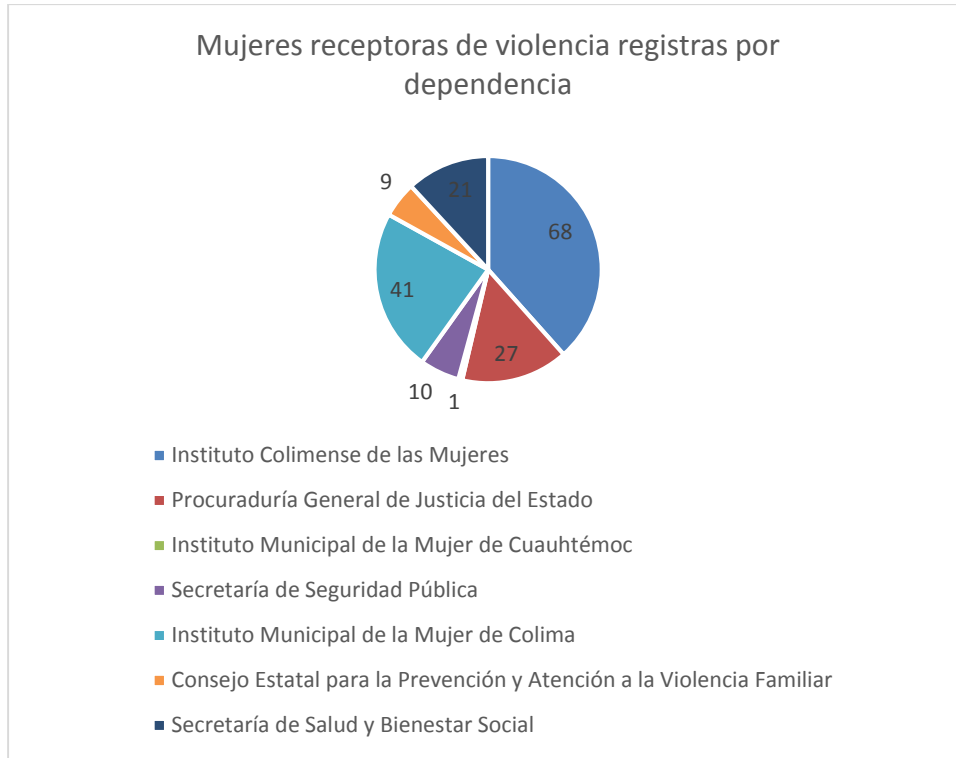
3 Gráfica de la cantidad de casos de violencia capturados por dependencia.

Mientras que en la gráfica 3, se identifican a las dependencias del Estado de Colima que registraron la información de 177 personas en el banco de datos.