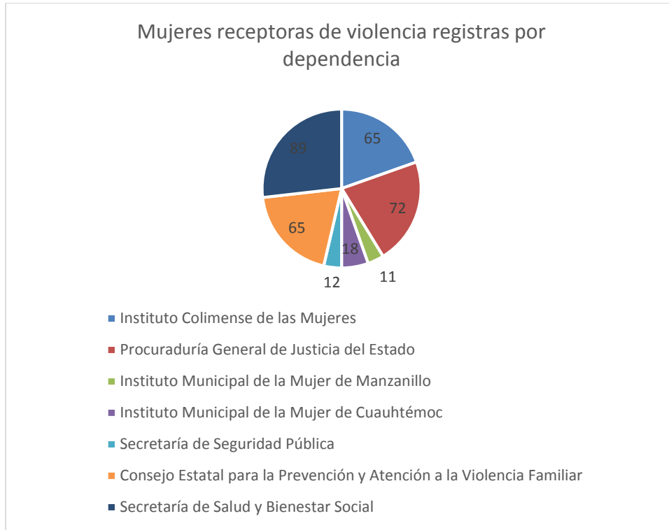
3 Gráfica de la cantidad de casos de violencia capturados por dependencia.

Mientras que en la gráfica 3, se identifican a las dependencias del Estado de Colima que registraron la información de 332 personas en el banco de datos.